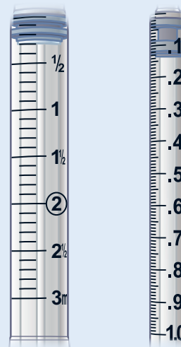
3,0 ml-sprøyte 1,0 ml-sprøyte